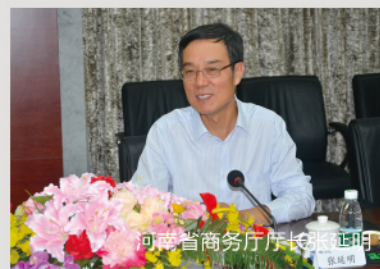
河南省商务厅厅长张延明

集团在河南投资兴业表示了感谢，他简要介绍了河南的现有的五大发展战略，描绘了河南未来发展的美好蓝图，并表示，得中原者得天下，河南省政府将不断优化营商环境，欢迎泉舜集团继续加大投资，与河南共同走向繁荣。