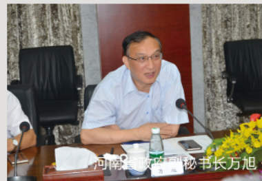
河南省政府副秘书长万旭