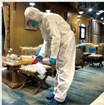
车辆外部消毒服务。

物业人员每天对前台大厅、洽谈区、休息区、沙盘区、儿童游乐区、样板间、卫生间等公共区域进行不少于4次无死角消毒。儿童游乐区和卫生间4小时消毒一次，针对接触频繁的公共通道门把手、儿童娱乐器材等公共设施随时用75%酒精擦拭消毒，保障客户和孩子的健康安全。此外，针对自驾前来购房的客户，售楼部人员将免费提供