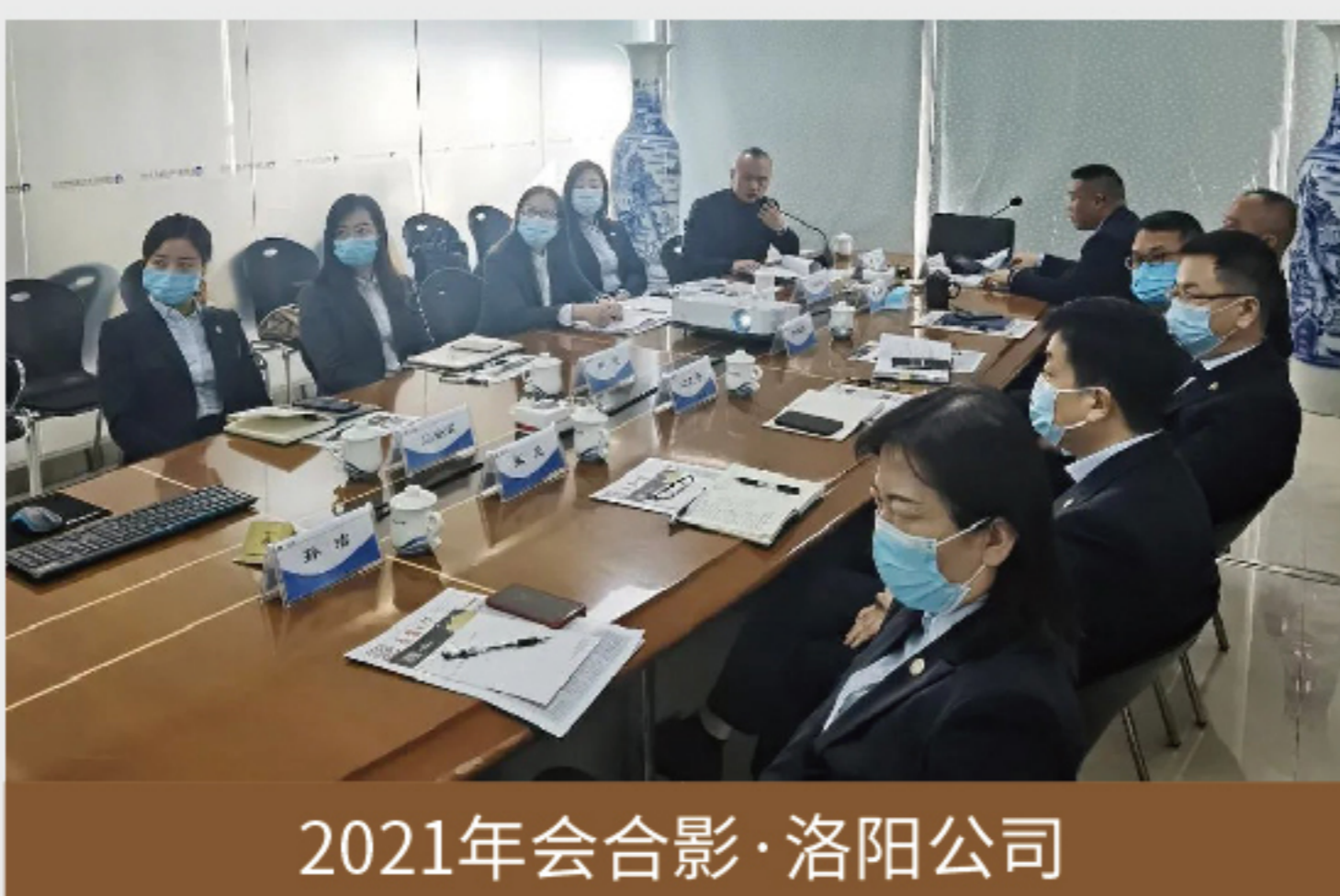
2021年会合影·洛阳公司