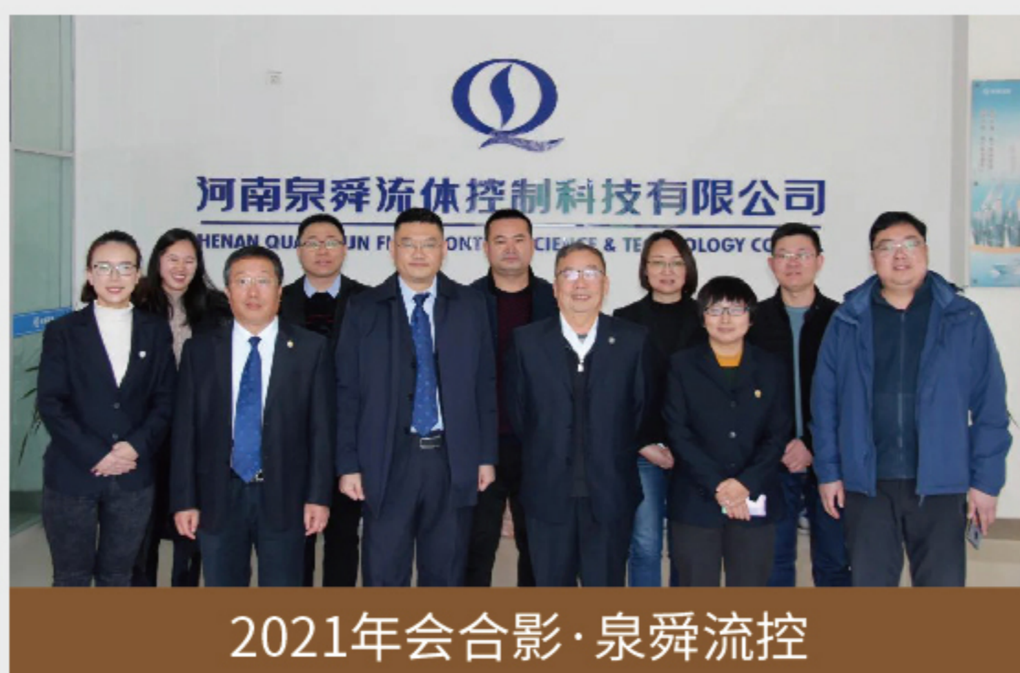
2021年会合影·泉舜流控